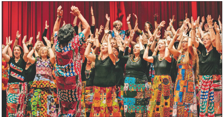
Mitreißende Lebensfreude und musikalische Vielfalt erwartet die Besucher:innen des Festes.

nen können sich die Besucher des Brückenfestes selbst überzeugen. Bleibt ein wichtiger Hinweis auf die Lebenssituation in Ratanda: Durch die Pandemie haben sich Arbeits- und Perspektivlosigkeit gerade bei jungen Leuten deutlich verschärft. Vor diesem Hintergrund konnte – mit großer Hilfsbereitschaft im Umfeld der Moko-Chöre – im vergangenen Jahr vor Ort mit dem Bokamoso Art Centre ein Farm-Projekt finanziert und gestartet werden, das neben der Förderung von Musik und Kultur Arbeits- und Ausbildungsplätze schafft, im Gemüseanbau und der Hühnerzucht, mit einer Schneiderei und nach Möglichkeit weiteren Handwerken; dazu mit einem Probenraum für eine neu gegründete Band und perspektivisch einer kleinen Konzerthalle. Für das Projekt darf gespendet werden, weitere Informationen auch unter www.afrikachor-Heidelberg.de