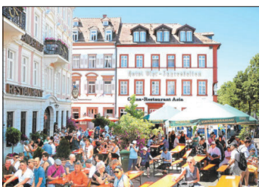
Vor der Pandemie war das Brückenfest das Ziel vieler Gäste – und nun hoffentlich auch wieder.

Der Verein verfolgt dabei „ausschließlich und unmittelbar gemeinnützige Zwecke.“ Als Stadtteilverein Altstadt wollen wir besonders die Interessen der „Altstädter“ vertreten, den Zusammenhalt im Stadtteil stärken, die bestehenden Einrichtungen vernetzen und Ansprechpartner für die Menschen im Stadtteil mit ihren großen und kleinen Sorgen sein.